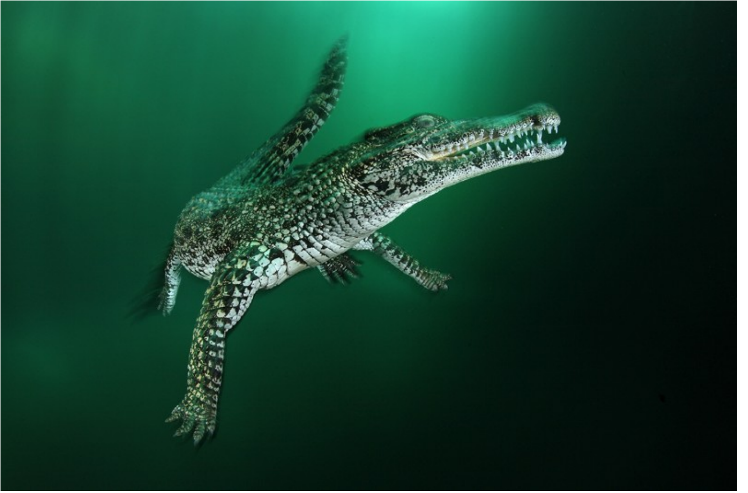
المصوّر: ميركو زاني Mirko Zanni . انغماسة ساحرة: تمساح كوبي يفوص في الماء.