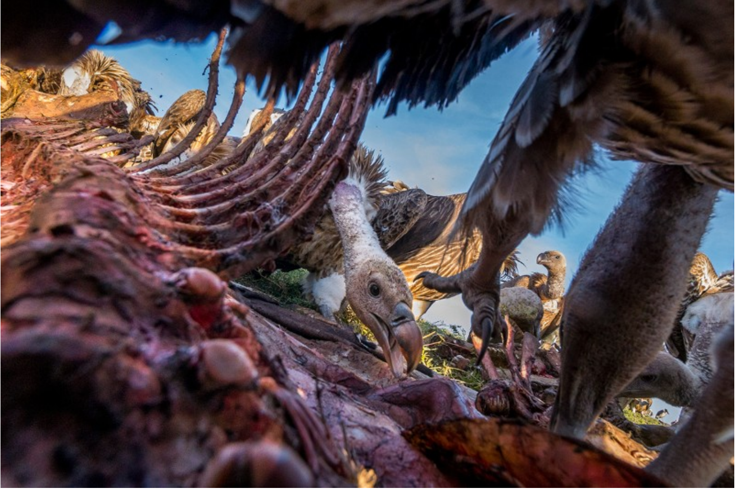
نزاع: نسور رابل Rüppell السّمراء والنّسور الإفريقيّة بيضاء الظهر تأكل من جثّة حمار وحشي في منطقة سيرينغيتي.