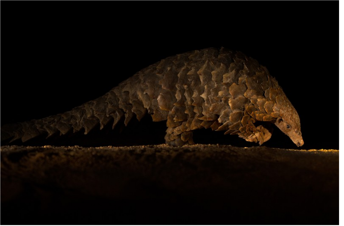
المطلوبون: آكل النمل، إنه الحيوان الأكثر صيداً في العالم، في محمية سابي ساندز، جنوب إفريقيا.