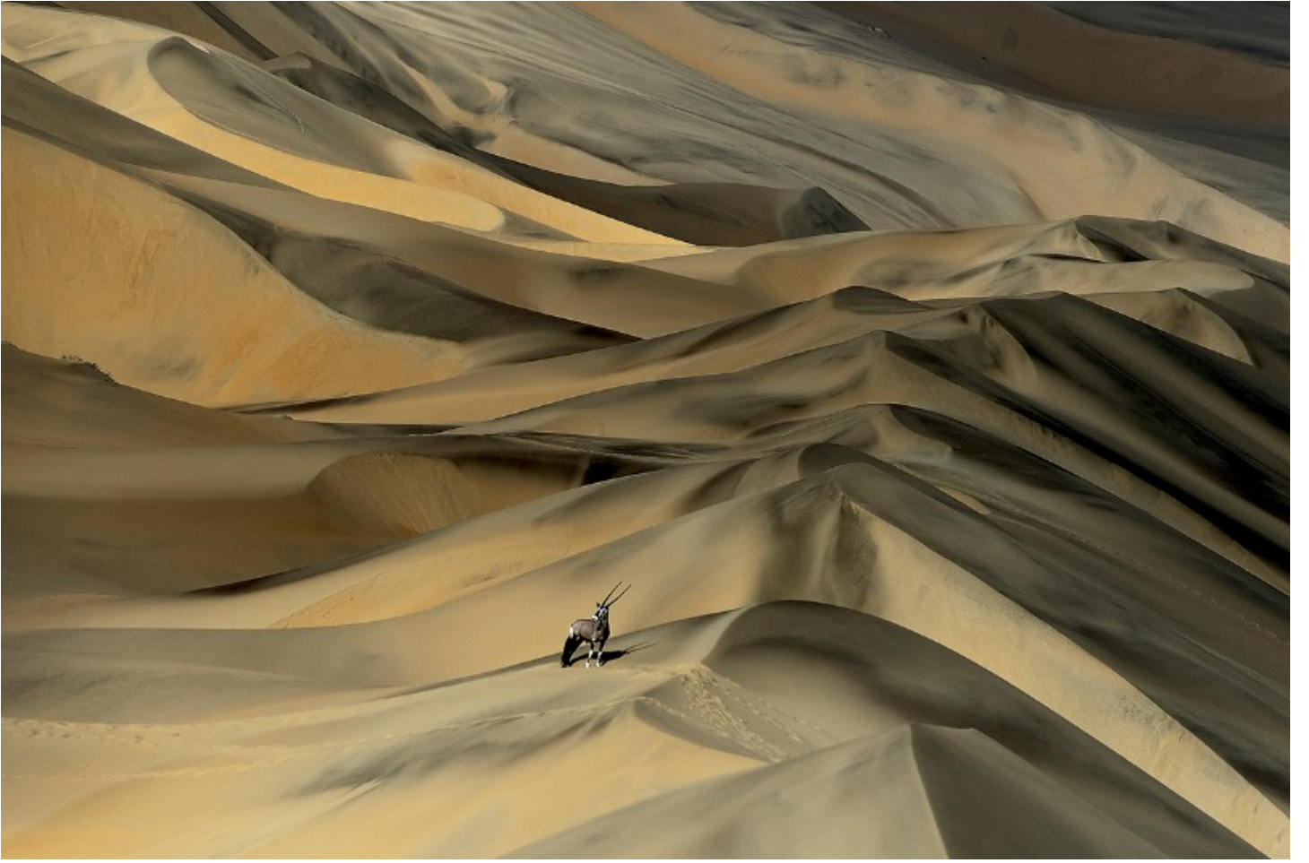
عالية وجافة: مها تبحث عن الماء أثناء الجفاف في ناميبيا قرب حدود أنغولا.