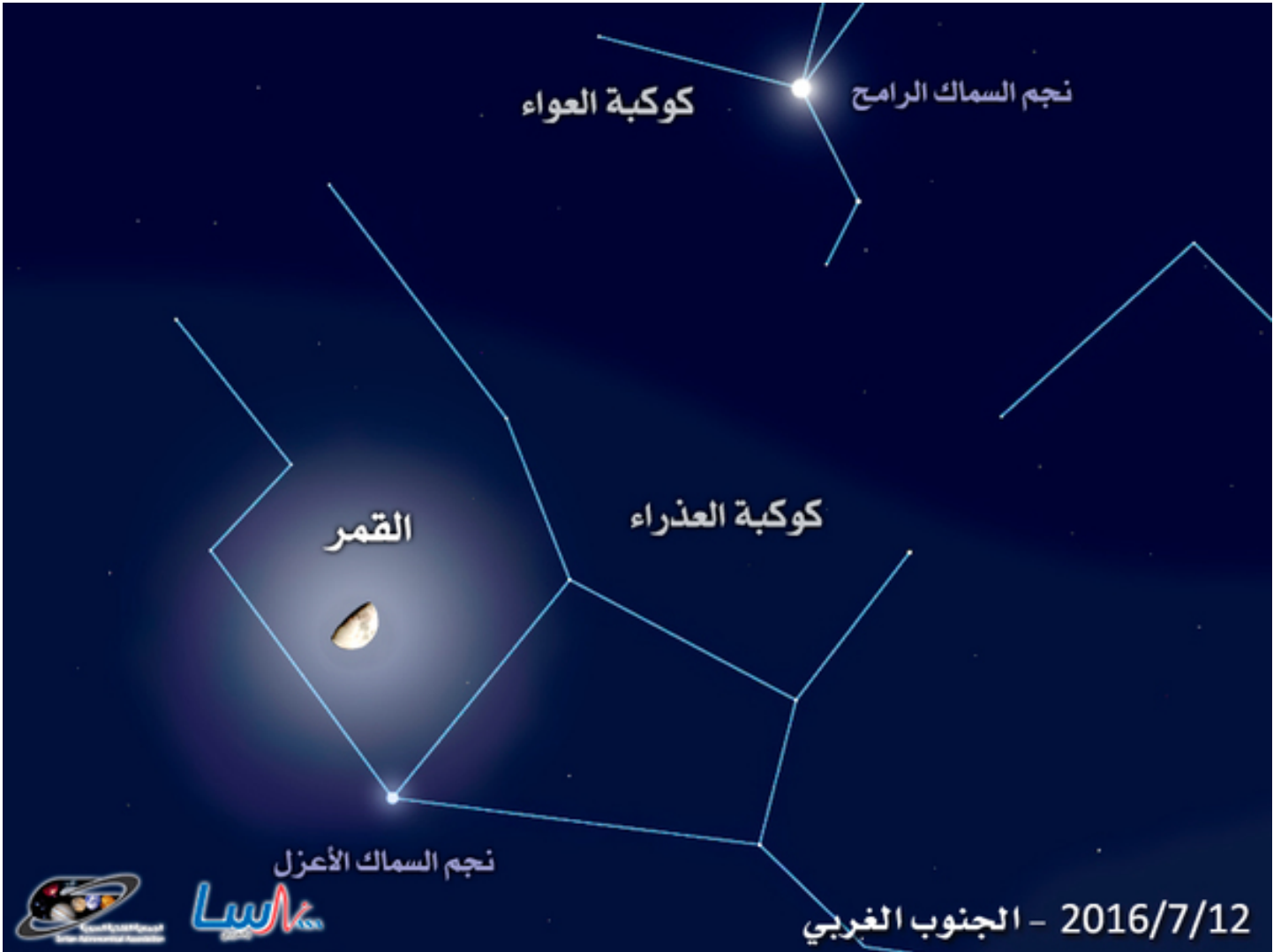
القمر في التربيع الأول مقترباً مع نجم السماك الأعزل في كوكبة العذراء

ويبقى عشاق السماء على موعد مع اقتران آخر رائع في منتصف الشهر، حيث يقترب القمر مع كوكبي المريخ وزحل في السماء الشرقية. وسيكون القمر أقرب إلى المريخ في كوكبة الميزان، في مساء الرابع عشر من الشهر. وسيكون أقرب إلى كوكب زحل في كوكبة الحواء على الجهة الشمالية لكوكبة العقرب، في الخامس والسادس عشر من الشهر. سيشاهد الاقتران بسهولة فوق الأفق الشرقي بعد حلول الظلام، حيث يبدو كوكب زحل بلون أصفر، أما كوكب المريخ ونجم قلب العقرب فيتألأ كل منهما بلون أحمر.