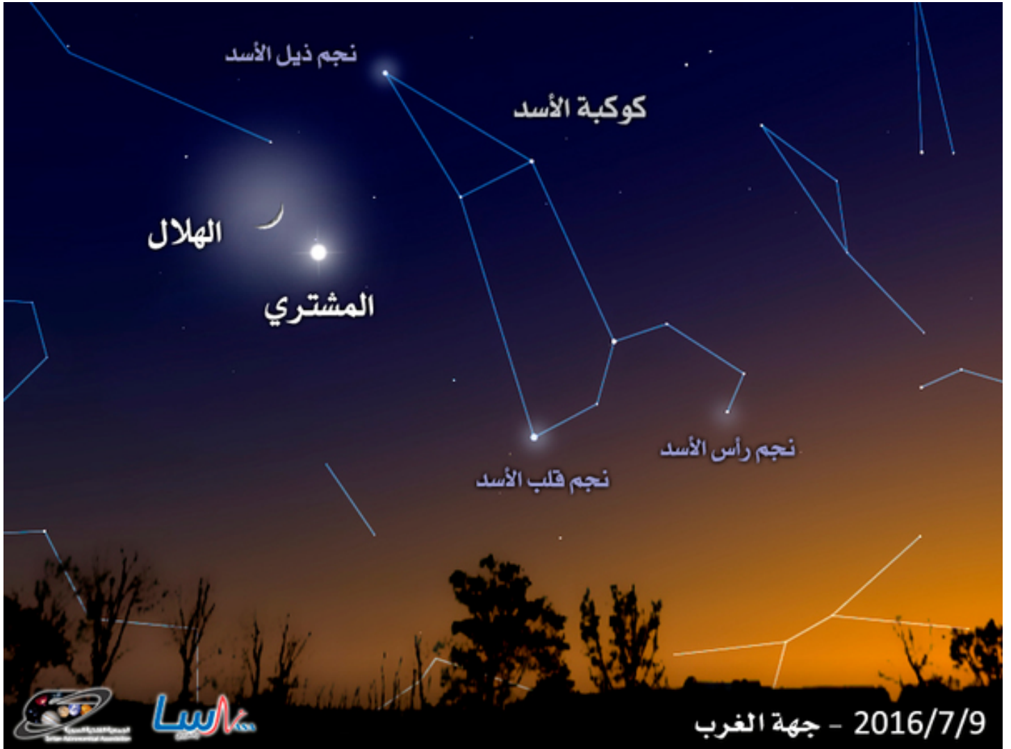
اقتران القمر مع كوكب المشتري في كوكبة الأسد

وفي الثاني عشر من الشهر، يقترب القمر مع نجم السماك الأعزل (Spica)، وهو أسطع نجوم كوكبة العذراء (Virgo). ويشاهد الاقتران في المساء، حيث يمكن رصد الأجرام باتجاه الجنوب الغربي.