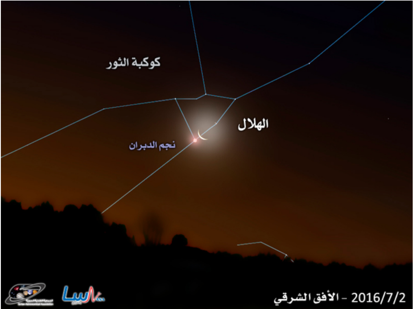
اقتران القمر مع نجم الدبران في كوكبة الثور

في التاسع من الشهر، يقترب القمر مع كوكب المشتري في كوكبة الأسد. ويشاهد الاقتران من بعد غروب الشمس في الجهة الجنوبية الغربية من السماء. وسيغرب الإثنين معاً قبل منتصف الليل. ومن الممكن العثور بسهولة على نجم قلب الأسد (Regulus)، وكذلك على النجوم الأخرى البارزة في كوكبة الأسد، مثل نجم ذنب الأسد (Denebola) ونجم رأس الأسد (RasElased).