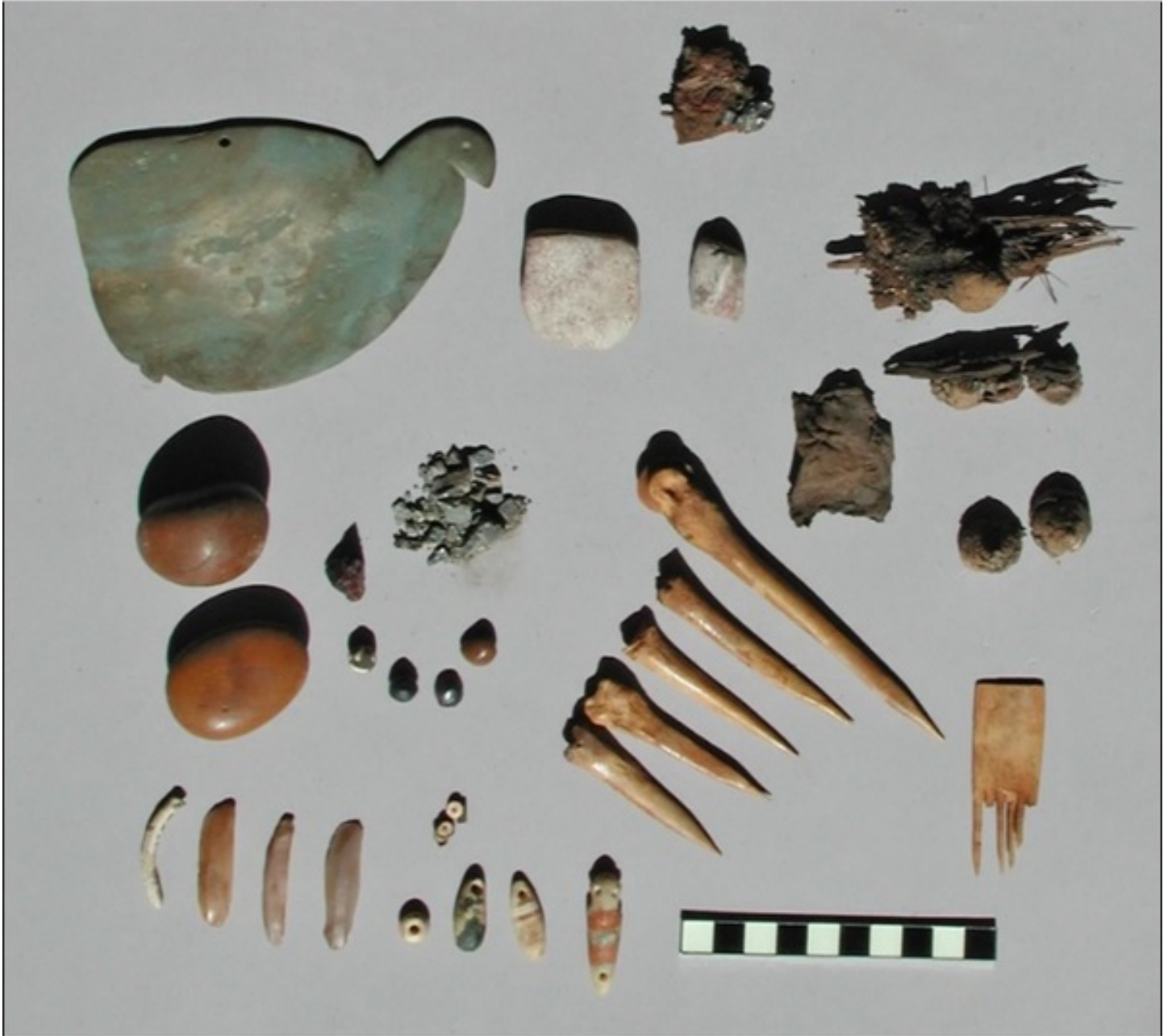
وُجدت مجموعة الأدوات هذه مع امرأة من مصر القديمة وتحتوي على أدوات من الممكن أنها أستخدمت للوشم.

كتب الباحثون في دراسةٍ جديدةٍ: "يُشير وجود المثقاب كجزءٍ من مجموعةٍ تتضمن أصباغ وراتينجات وتمائم وبخور في قبر امرأةٍ مسنةٍ في هيراكونبوليس إلى أن الوشم كان يجري على أيدي مُتخصصين ترافقه مختلف الطقوس والاحتفالات".