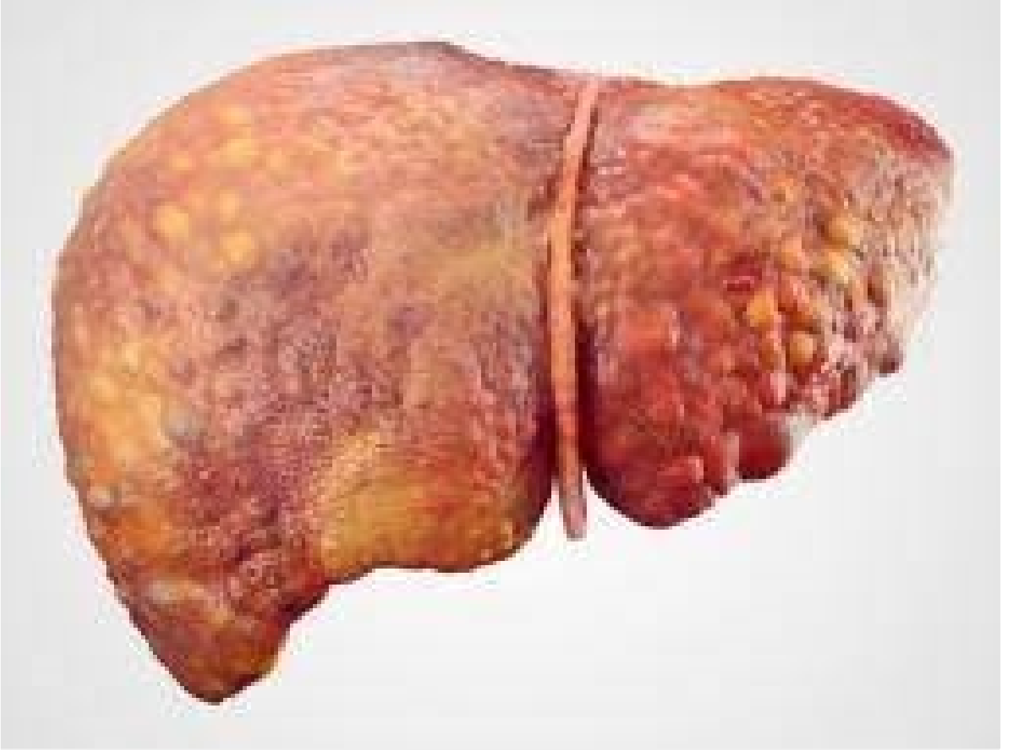
كبد مُصابة بالسرطان